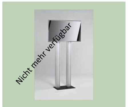
46 Inch LED-Bildschirm auf Stativ €250,00