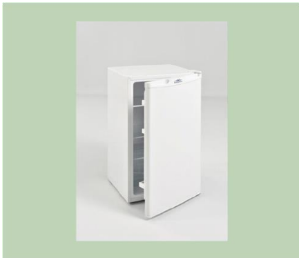
Kühlschrank 140 ltr. €52,00