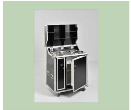
Abfluss, Herd, Kühlschrank, Wasserhahn €200