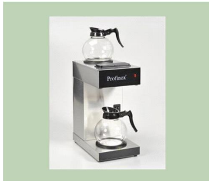
Kaffeemaschine inkl. Filter €59,00