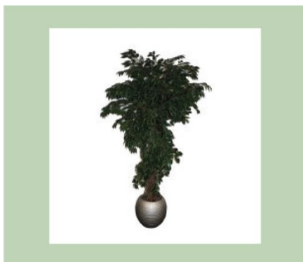
Pflanze 180 cm hoch inkl. Topf €20,00