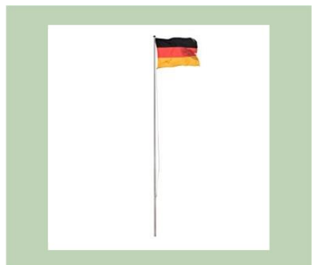
Fahnenmast 7 mtr (für Banner mit Tunnel) €29,00