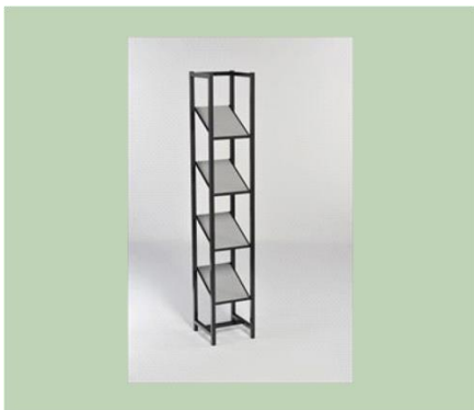
Flugblätterregal(e) schwarz/grau €55,00