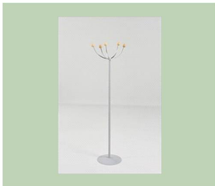
Garderobe (H 166 cm) €16,00