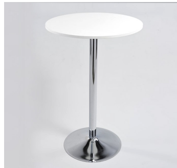
Stehfisch € 45,-