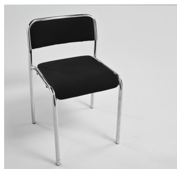
Stuhl € 15,-