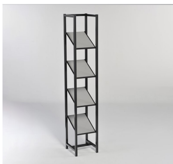
Prospektständer schwarz/grau € 55,-