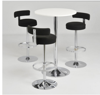
Bar tafel mit 3 barkrukken € 107,-