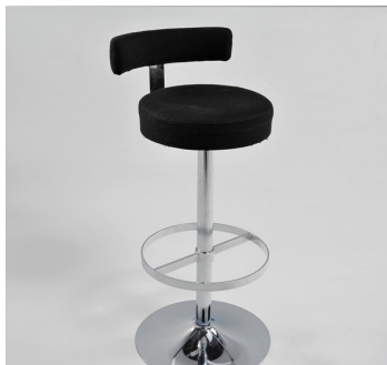
Barhocker € 23,-