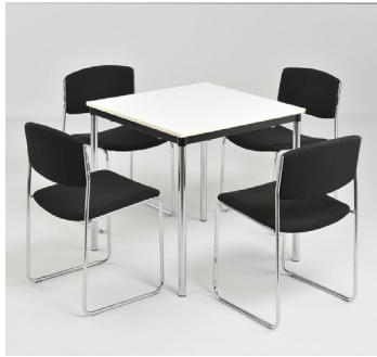
Tisch(e) und 4 Stühle € 95,-