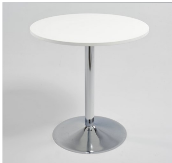
1 Tisch € 40,-