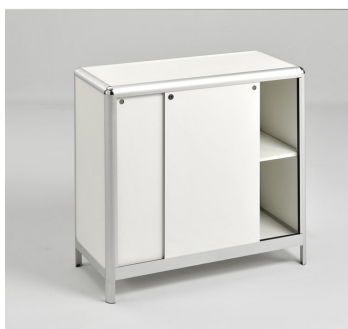
Abschließbarer Theke € 82,50