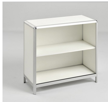
Theke € 65,-