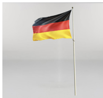
Fahnenmast 7 m € 29,-